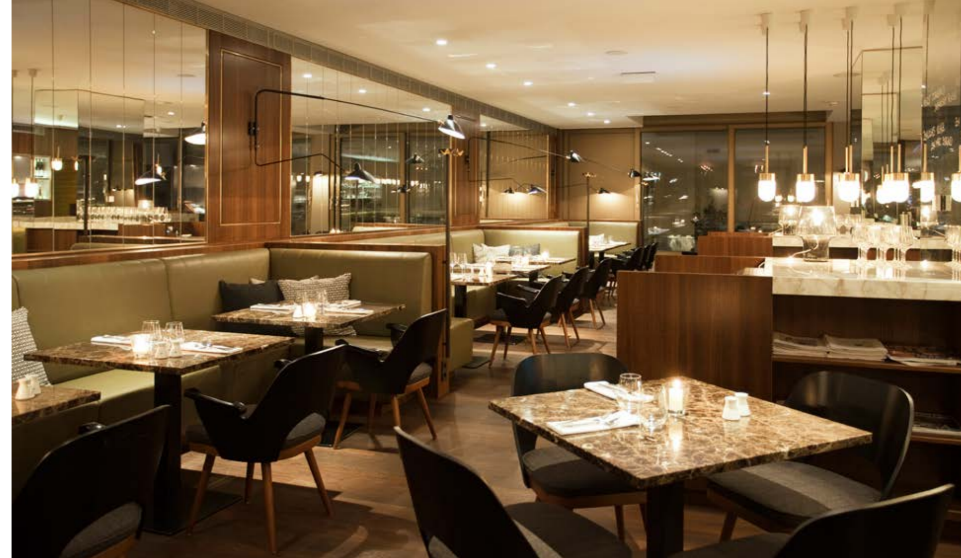
Guesthouse-Philosophie: In einem Gasthaus sitzt man gerne zusammen, trinkt gemeinsam und plaudert, ohne an die Zeit zu denken. Denn Luxus und Behaglichkeit schließen einander nicht aus.

Just like our bread, we want to be available to you all year long. A good host takes care of his guests, and that's exactly what we do. Whatever it is, we will do our very best to grant any and all request! Just stop by the front desk to ask. While our in-house services are comprehensive, we will consult our outside resources to expertly handle things. Is a tight back after hours of sightseeing bothering you? No problem! A professional massage provides quick relief. Our goal is for your precious hours in the city and at The Guesthouse Vienna to be how they should be: Fabulous.