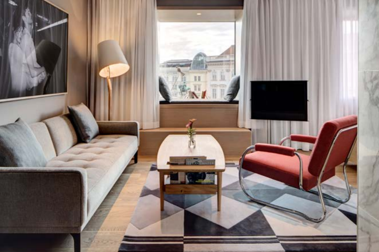
Ein Hotel soll sich wie ein Zuhause anfühlen. Im The Guesthouse achten wir deshalb auf Sorgfalt in der Gestaltung und Ausstattung, so verwöhnen beispielsweise Molton Brown Pflegeprodukte und handgemachte Seifen der Seifenmanufaktur Wolfgang Lederhaas den Körper.