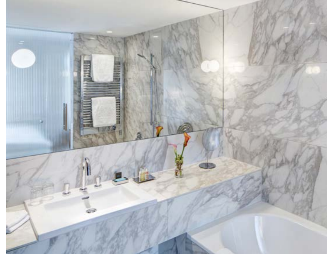
A hotel should feel like home. In The Guesthouse, we therefore take great care in our choice of interiors and facilities. As an example, our selection of Molton Brown toiletries and handmade soaps from Seifenmanufaktur Wolfgang Lederhaas will pamper your body.