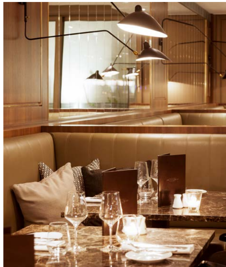
Fine materials underline the stylish and intimate atmosphere which is present in the suites, the rooms, and throughout all details of the Brasserie & Bakery.